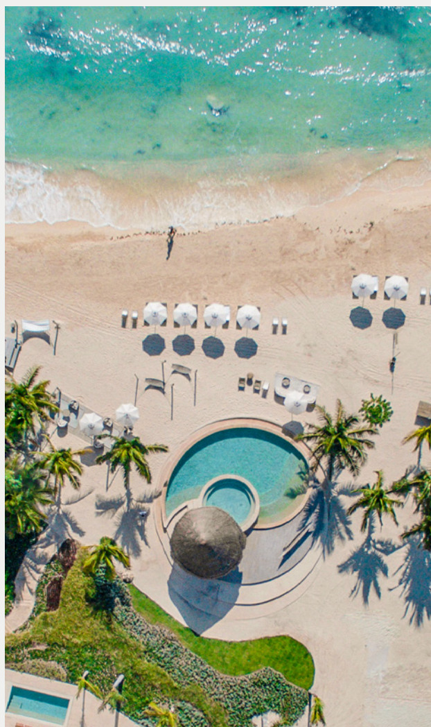
Costa Beach Club